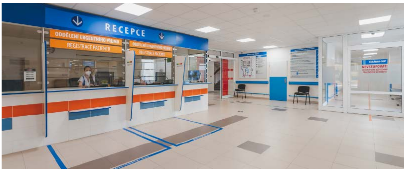
Recepce Oddělení urgentního příjmu