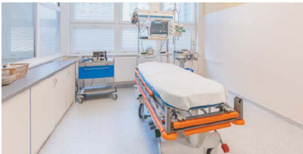
Izolační box

Rádi bychom na tomto místě poděkovali za skvělou spolupráci všem zúčastněným oddělením, ale i všem dalším, ke kterým od nás pacienti v této době směřovali. Zvláště chceme poděkovat Infekčnímu oddělení, laboratořím a radiologickému komplementu. V neposlední řadě děkujeme též Oddělení ústní, čelistní a obličejové chirurgie – za pochopení našich prostorových nároků.