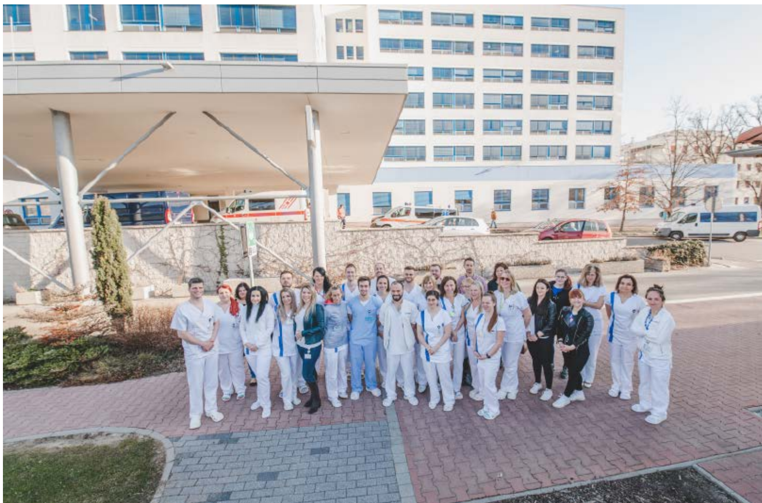
Část kolektivu Oddělení urgentního příjmu