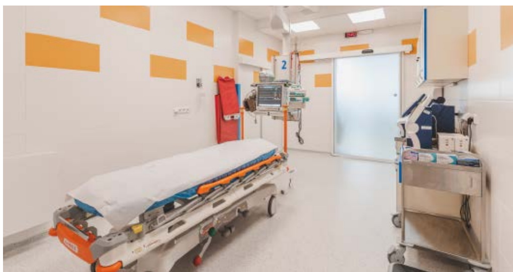
Box pro ošetření kriticky nemocných

Na lůžkové části Oddělení urgentního příjmu ošetřujeme pacienty s rizikem selhání životních funkcí a ty, u nichž hrozí nebezpečí z prodlení (priorita 1, 2 dle ESI – Emergency Severity Index). Péči o ně kompletně zajišťuje personál našeho oddělení. Dále jsou zde ošetřováni pacienti z akutních ambulancí, jejichž stav vyžaduje uložení na lůžko (imobilita, potřeba infuzní terapie, většího množství diagnostických úkonů a podobně).