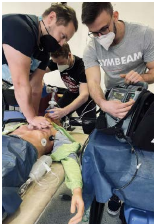
Momentka ze vzdělávacího kurzu pro nelékaře Oddělení urgentního příjmu

Nemocnice České Budějovice, a.s., patří do sítě nemocnic s urgentním příjmem I. typu a v roce 2021 získala akreditaci pro vzdělávání v oboru urgentní medicína.