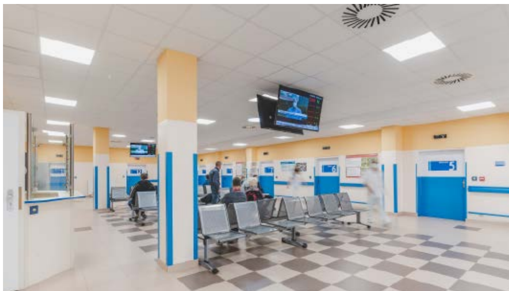
Pohled do haly urgentního příjmu | Foto: Jan Luxík

V ambulancím traktu je k dispozici ultrazvuková vyšetřovna sdílená všemi zúčastněnými odbornostmi a zákrokový sálek pro drobné chirurgické výkony bez nutnosti podání celkové anestezie. V hale umístěná čekárna umožňuje důstojné vyčkání na ošetření, je vybavena jak automaty s nápoji či občerstvením, tak i velkoplošnými obrazovkami, které plní zároveň funkci monitorů vyvolávacího systému. Prostor je dimenzován tak, aby