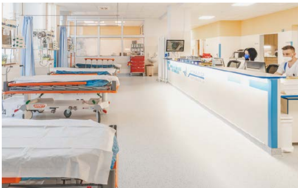
Expektační lůžka Oddělení urgentního příjmu

V návaznosti na postupující rekonstrukci dalších částí nemocnice se oborové obsazení prostor urgentního příjmu bude měnit. Dočasně by zde měla najít útočiště traumatologická ambulance, což bude prostorově a organizačně velmi náročná etapa. Po dokončení přestavby by v prostorách urgentního příjmu měly fungovat akutní ambulance interních oborů z pavilonu C (konkrétně interny, neurologie, kardiologie, gastroenterologie a pneumologie), ambulance obecné chirurgie a zázemí by zde měla mít také lékařská pohotovostní služba (LPS,