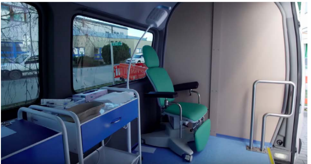
Odběrový mikrobus