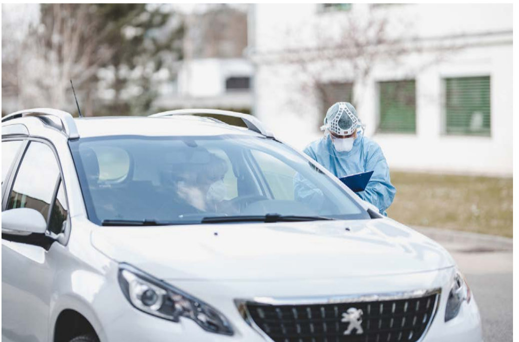
Drive-in Infekčního oddělení

k nám, zajistíme je a léčíme jejich akutní potíže a přitom čekáme na vyšetření na COVID-19. Pokud je negativní, pokračují dál na další oddělení, pokud je vyšetření pozitivní, zůstávají u nás.